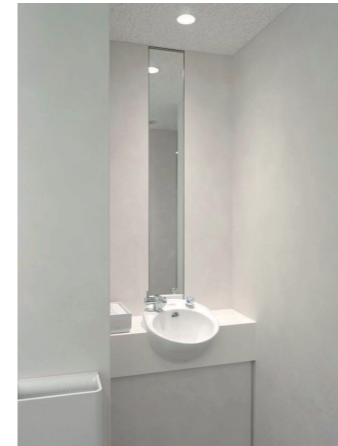
基準階 女性トイレ 歯みがき・ スタイリングコーナー

荷物配慮ができるツインデッキカウンタースペースアップタイプを採用。改修時のコンセプト「Cool×Elegant」にあうように、青色のモザイクタイルで空間を演出している。