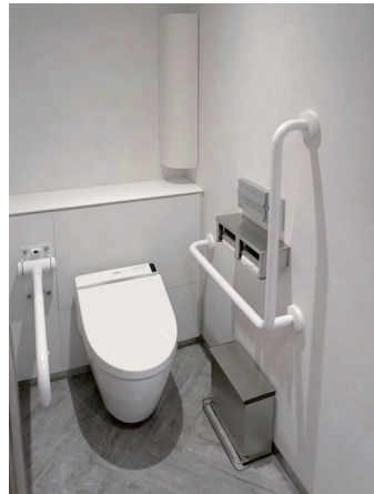
基準階 女性トイレ 大便器ブース

男女トイレそれぞれにひろびろブースを1ヶ所設置。はね上げ手すりとL型手すりを備え、車いす使用者にも配慮できるようにしている。着替え用のフッキングボードも設置している。