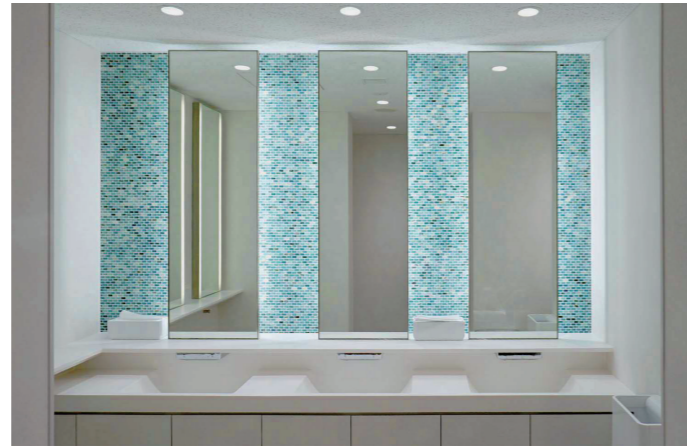
基準階 女性トイレ 洗面コーナー

1997(平成9)年に建設されたテナントオフィスビル。築23年が経ち、共用部の改修を実施した。